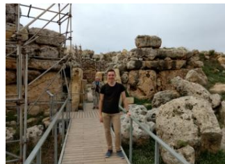
Abbildung 2: Ġgantija-Tempel