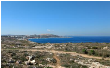
Abbildung 2: Wandern auf Malta

Im Vergleich mit Deutschland fällt auf, dass die Physiotherapeuten auf Malta ein höheres gesellschaftliches Ansehen haben. Die Patienten sind sehr dankbar und vertrauen dem Physiotherapeuten wie ihrem Doktor. Ein weiterer Unterschied zu Deutschland liegt im Zeitverständnis der Bevölkerung. Teilweise kommen die Patienten nicht immer pünktlich, wodurch die Physiotherapeuten auch häufiger mal eine längere Pause zwischen den Behandlungen haben.