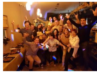
Abbildung 3: Weihnachtsfeier

Neben der Arbeit bei PlanetPhysio habe ich besonders die freie Zeit während meines Auslandspraktikum genossen. Neben der beeindruckenden Landschaft und tollen Stränden, kann man auf Malta Menschen aus aller Welt kennen lernen. Es gibt jede Woche tolle Veranstaltungen und Orte zu entdecken (s. Abb. 2-5).